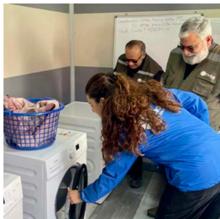
Die Wäsche ist gewaschen und getrocknet

weil gerade diese Arbeit auf Grundstücken ohne Zugang zu Wasser und Elektrizität fast nicht möglich ist. Da die Hilfe dringend benötigt wurde, hat der Heliand das Projekt im April mit € 5.000,00 vorfinanziert in der Hoffnung, dass in diesem Jahr noch ausreichend Spenden eingehen. Inzwischen funktioniert der „Waschsalon“ in Tamarufal, wo für verschiedene Ortsteile in Viña del Mar soziale Dienste für die vom Megafeuer - wie die Katastrophe in Chile genannt wird - betroffenen Familien angeboten werden und wo natürlich Zugang zu Wasser und Elektrizität vorhanden ist. Getragen wird der