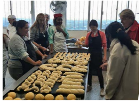
Die Wäsche ist gewaschen und getrocknet

Im April 2024 habe ich bei einem Projektbesuch für die Stiftung Seniorenhilfe weltweit in Montevideo/Uruguay die Gelegenheit genutzt, die Sozialorganisation CEPRODIH, bei der das vom Heiland im vergangenen Jahr geförderte Bildungsprogramm zur Drogenprävention durchgeführt wurde, kennenzulernen und mich mit den Verantwortlichen auszutauschen. Der Besuch war eine gute Möglichkeit, den Kontakt zu vertiefen. Die Arbeit von CEPRODIH und die Mitarbeiter/innen haben mich beeindruckt, weil - als Voraussetzungen für wirksame soziale Arbeit - Engagement, soziale Fachlichkeit und sozialadministrative Kompetenz zusammenkommen. Das gilt für