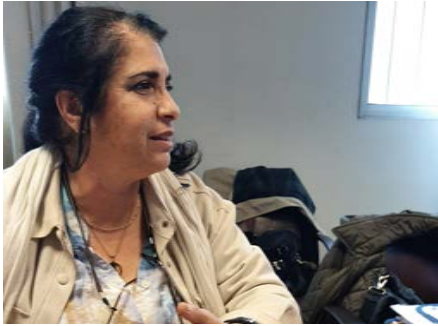
Helferinnen im Waschsalon

Im April 2024 habe ich bei einem Projektbesuch für die Stiftung Seniorenhilfe weltweit in Montevideo/Uruguay die Gelegenheit genutzt, die Sozialorganisation CEPRODIH, bei der das vom Heiland im vergangenen Jahr geförderte Bildungsprogramm zur Drogenprävention durchgeführt wurde, kennenzulernen und mich mit den Verantwortlichen auszutauschen. Der Besuch war eine gute Möglichkeit, den Kontakt zu vertiefen. Die Arbeit von CEPRODIH und die Mitarbeiter/innen haben mich beeindruckt, weil - als Voraussetzungen für wirksame soziale Arbeit - Engagement, soziale Fachlichkeit und sozialadministrative Kompetenz zusammenkommen. Das gilt für