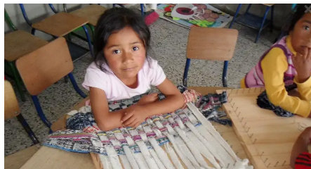
praktisches Lernen: Weben

heit genutzt, einfach miteinander zu reden und ihre Fähigkeiten auszuprobieren. Für sie war es ein lebenspraktischer Kurs. Es bestätigt sich wieder einmal, dass auch Kleinprojekte für die einzelnen große Wirkung haben können.