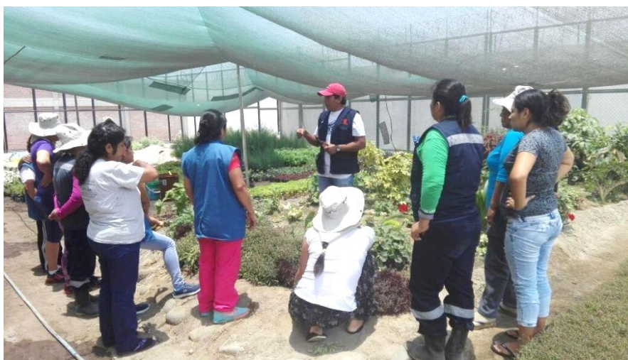
Im Frauengefängnis in Tacna/Peru: praktische Anleitung für Gartenarbeit.